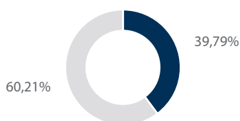
Prime 10 part. - (%) tot.

Le prime 10 partecipazioni in portafoglio come percentuale del Patrimonio netto totale. Le partecipazioni in portafoglio sono soggette a modifiche in qualsiasi momento. I riferimenti a titoli specifici non devono essere interpretati come una raccomandazione di acquisto o vendita né ipotizzati come remunerativi.